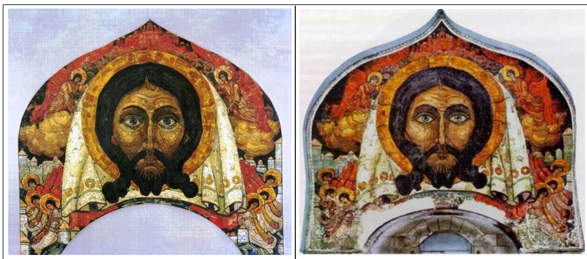
Н.К. Рерих. Спас Нерукотворный. 1910.

Не говоря уже о смелости мысли дать на портале храма один из самых больших ликов Христа - до 6 арш., и по рисунку, и по красивым краскам, это является одною из самых ярких и красивых религиозных работ последнего времени.