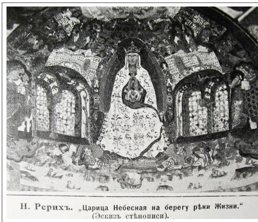
Н. Рерихъ. „Царица Небесная на берегу рѣки Жизни.“ (Эскизъ стѣнописи).