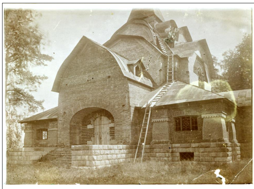
Строительство храма Св. Духа во Флёново. 1911 г.