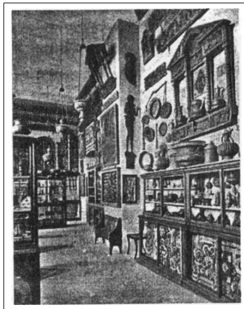
Зал Музея М.К. Тенишевой